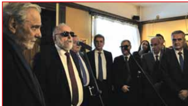
Ομιλία στο Μουσείο Φιλικής Εταιρείας.