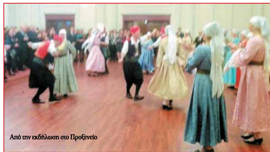
Από την εκδήλωση στο Προξενείο

Υ.Γ.: Οδησσο με εντυπωσιάσες. Θα ξανάρθω.