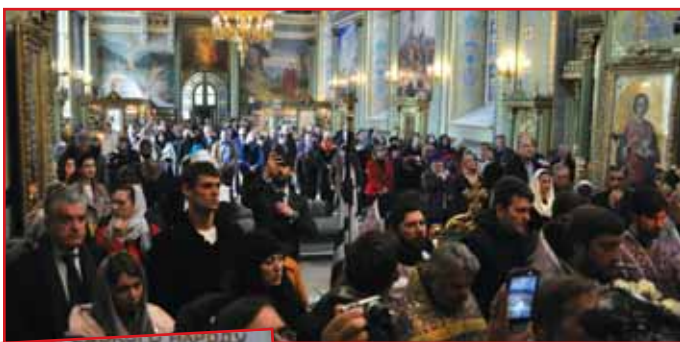
Από τη δοξολογία στην Αγία Τριάδα