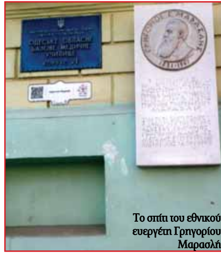
Το στίπ του εθνικού ευεργέτη Γρηγορίου Μαρασλή