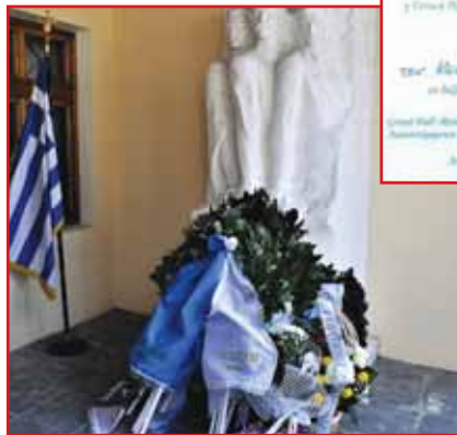
Κατάθεση στεφάνων στο Μουσείο των Φιλικών