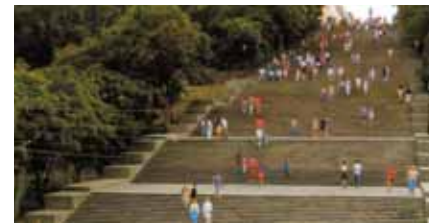
Οι σκάλες Ποτέμκιν. Παγκόσμιο σύμβολο Εκδηλώσεις στην Οδησό σελ. 9, 15