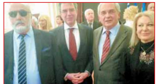
Ο υπουργός Ναυτιλίας και Νησιωτικής Πολιτικής Π. Κουρουμπλής, ο Πρόεδρος της Ελλάδας στην Ουκρανία Γ. Πουκαμισάς και η Γεν. Πρόξενος της Ελλάδας στην Οδησό Δέσποινα Κουκουλοπούλου με τον πρόεδρό μας Α. Ζαφειρόπουλο