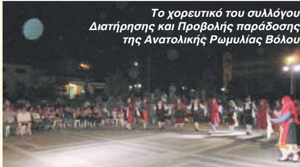
Το χορευτικό του συλλόγου Διατήρησης και Προβολής παράδοσης της Ανατολικής Ρωμυλίας Βόλου