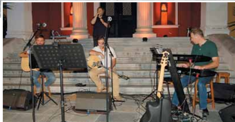
Φωτό από την εκδήλωση στο Μουσείο Βόλου

Η είσοδος για το κοινό σε όλες τις παραπάνω εκδηλώσεις ήταν ελεύθερη.