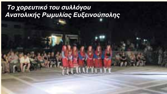
Το χορευτικό του συλλόγου Ανατολικής Ρωμυλίας Ευξεινούπολης

Την εκδήλωση τίμησαν με την παρουσία τους ο Βουλευτής του Σύριζα Ν. Μαγνησίας κ. Μεϊκόπουλος Αλέξανδρος, ο Αντιδήμαρχος Βόλου - Ν. Ιωνίας & Περιφερειακών Δημοτικών Ενοτήτων κ. Λιβογιάννης Δημήτριος, η Αντιδήμαρχος Παιδείας και Πολιτισμού κ. Μποντού - Τοκαλή Γεωργία, ο Πρόεδρος της Δ.Κ. Νέας Αγχιάλου κ. Τζαερλής Κων/νος, ο Πρόεδρος της Τ.Κ. Αϊδινίου κ. Βαλκανιώτης Δημήτριος, μέλη του Τοπικού Συμβουλίου, οι Πρόεδροι των Συλλόγων που συμμετείχαν στην εκδήλωση και πλήθος κόσμος.