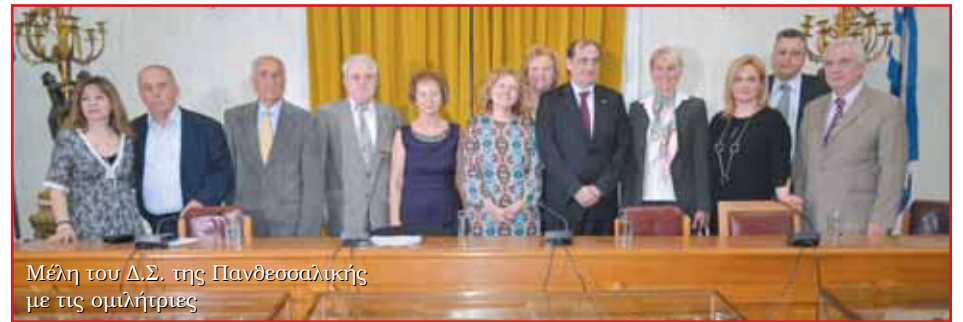
Μέλη του Δ.Σ. της Πανθεσσαλικής με τις ομιλήτριες