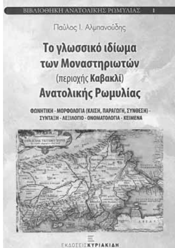
«Βιβλιοθήκη Αν. Ρωμυλίας αρ. 1» Εκδ. Κυριακίδη, Θεσ/νίκη 2014, σ. 412

Έδωσε την ευκαιρία στον δρ. Παύλο Αλμπανούδη, γεννημένο στο Νέο Μοναστήρι Φθιώτιδας