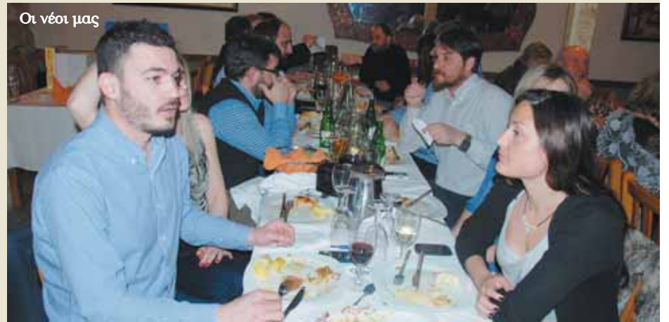
Οι νέοι μας

Το Δ.Σ. απευθύνει θερμές ευχαριστίες στους χορηγούς της λαχειοφόρου.