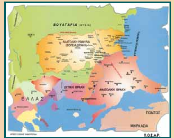
περιοχές δράσης των κατά τόπους Συλλόγων.

Σας γνωστοποιούμε επίσης ότι μέσα στα σχέδια της Π.Ο.Σ.Α.Ρ., είναι οι τακτικές Συνεδριάσεις της να πραγματοποιούνται σε διαφορετικές κάθε φορά