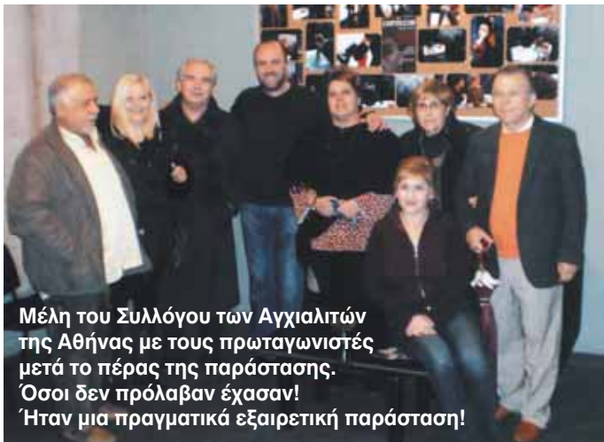
Μέλη του Συλλόγου των Αγχιαλιτών της Αθήνας με τους πρωταγωνιστές μετά το πέρας της παράστασης. Όσοι δεν πρόλαβαν έχασαν! Ήταν μια πραγματικά εξαιρετική παράσταση!