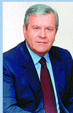
ΝΑΚΟΣ ΑΘΑΝΑΣΙΟΣ 31.208 σταυροί ΥΦΥΠΟΥΡΓΟΣ ΕΣΩΤΕΡΙΚΩΝ Δ. Δ. & Α.

Το Δ.Σ. του Συλλόγου των Αγχιαλιτών της Αθήνας συγχαίρει τους νεοεκλεγέντες βουλευτές της Μαγνησίας και τους εύχεται καλή επιτυχία στο έργο τους. Ο καθένας από την μεριά του (συμπολίτευση ή αντιπολίτευση) να εργαστεί με όλες του τις δυνάμεις για το καλό της πόλης μας, της Μαγνησίας και όλης της Ελλάδας.