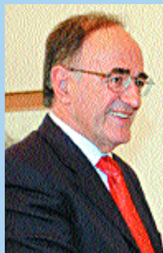
ΣΟΥΡΛΑΣ ΓΕΩΡΓΙΟΣ 23.646 σταυροί Α ΑΝΤΙΠΡΟΕΔΡΟΣ ΤΗΣ ΒΟΥΛΗΣ