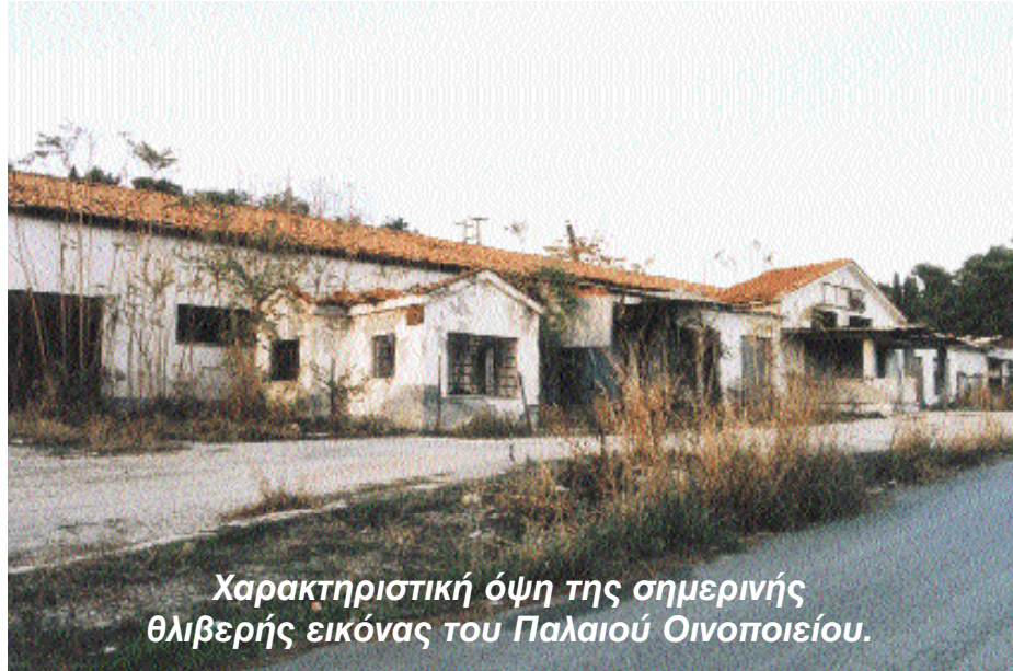
Χαρακτηριστική όψη της σημερινής θλιβερής εικόνας του Παλαιού Οινοποιείου.

Παράλληλα, από την απαλλοτρίωση αυτή, πολλαπλώς ωφελημένος εξήλθε ο τοπικός Αγροτικός Συνεταιρισμός ο οποίος εισέπραξε από το ΥΠΠΟ μια παχυλή αποζημίωση με την οποία μπόρεσε να ξεκινήσει άμεσα τις διαδικασίες ανέγερσης (εκτός αστικής πλέον περιοχής) του νέου μεγάλου και σύγχρονου οινοποιείου, να καλύψει την απαιτούμενη δική του οικονομική συμμετοχή, δια της οποίας εξασφάλισε την απαραίτητη χρηματοδότηση από εθνικούς και κοινωνικούς πόρους, να ολοκληρώσει το έργο