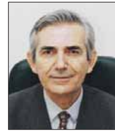
Γράφει ο καθηγητής Παύλος Κ. Τούτουζας, Διευθυντής του ΕΛ.Ι.ΚΑΡ