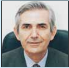
Γράφει ο Πάυλος Κ. Τούτουζας, Διευθυντής ΕΛ.Ι.ΚΑΡ.